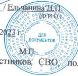
Таб.8 «Список обучающихся, из семей участников, СВО получающих горячее питание»