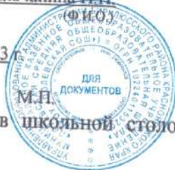
Таб.10 «Список обучающихся, не питающихся в школьной столовой по заявлению родителей»