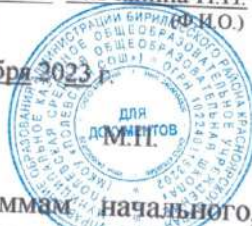
Таб.4 «Список обучающихся по программам начального, основного, среднего общего образования из семей, состоящих в СОН, сверенные с КДН»