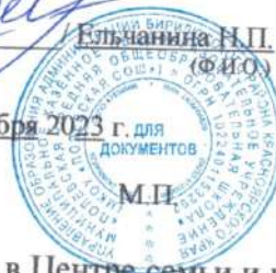
Таб.9 «Список обучающихся, проживающих в Центре семьи и питающихся в столовой Центра»