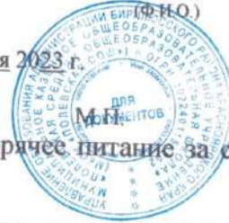
Таб.7 «Список обучающихся, получающих горячее питание за счет средств родителей»